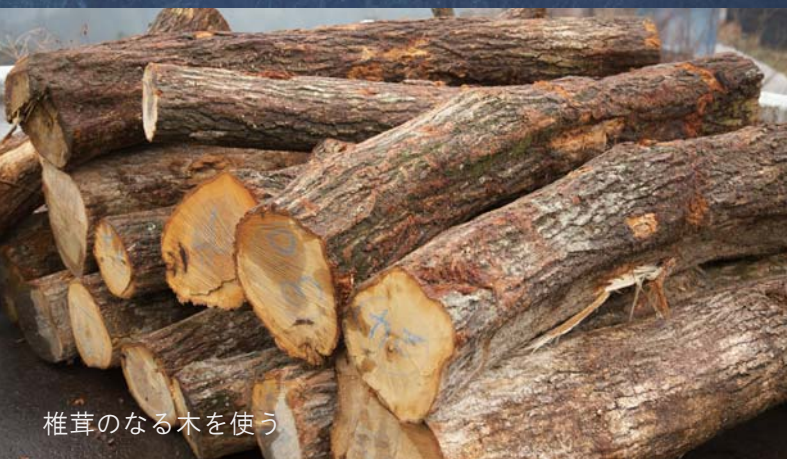
椎茸のなる木を使う